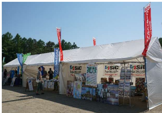
出店ブース 当日の様子