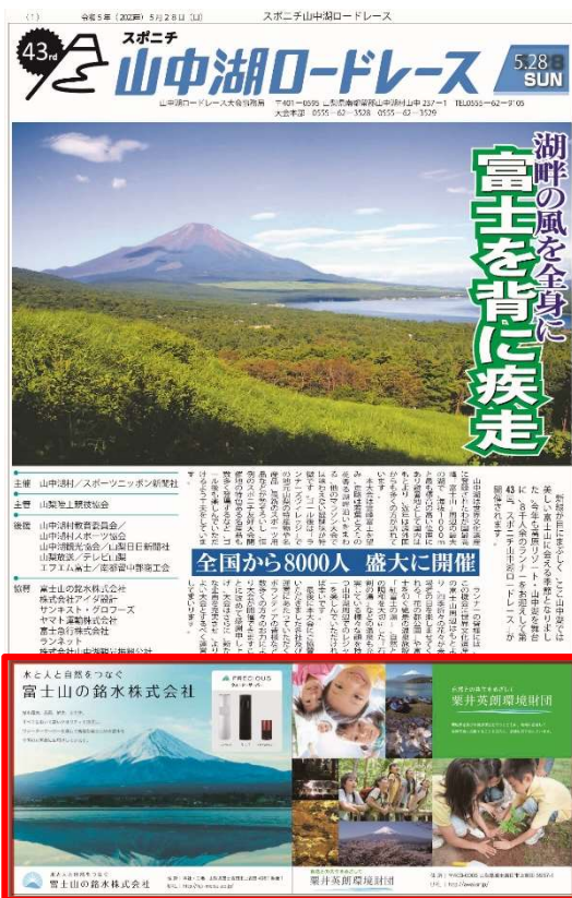
表紙面下部広告掲載イメージ