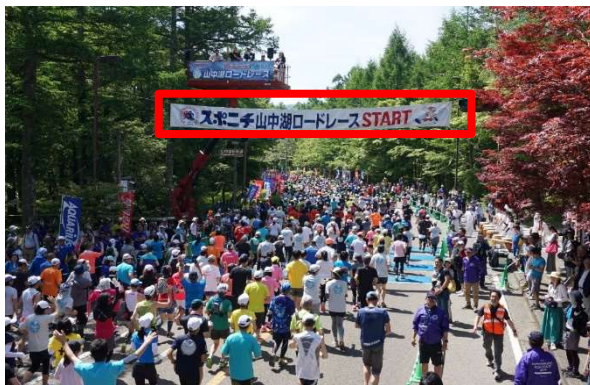
横断幕掲出イメージ