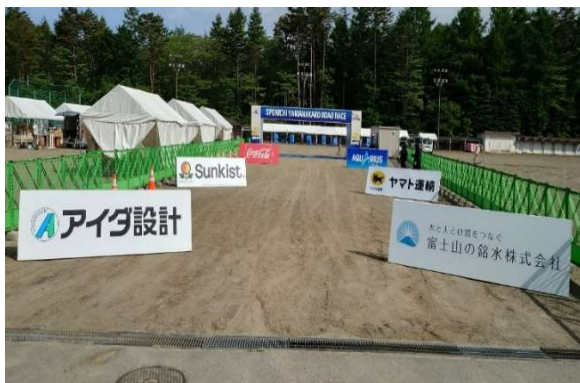
看板掲出イメージ